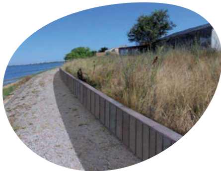
Photomontage du système de protection des Cabanes de Pérois © EGIS eau