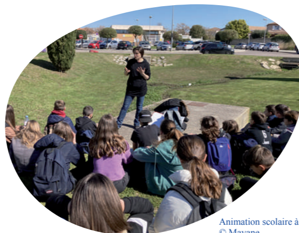
Animation scolaire à Maugeio