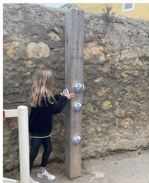
Pose des repères de crues par les écoliers de Mudaison

Budget : Fabrication & pose : 15 000 € TTC